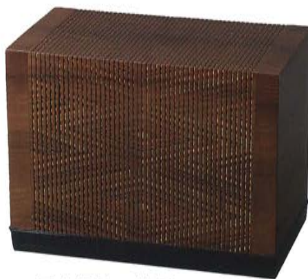
日本伝統工芸展 「日本工芸会新人賞」受賞作 「神代桂菱紋重糸目筋箱」