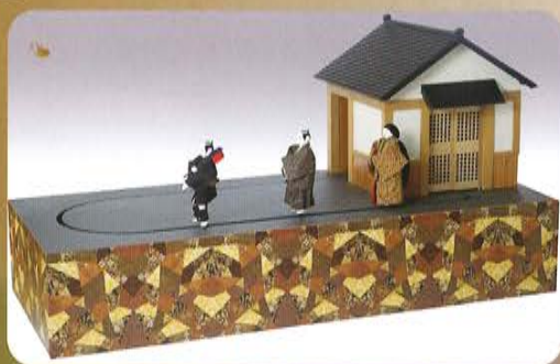
「寄木からくり大名行列三人揃」全体図