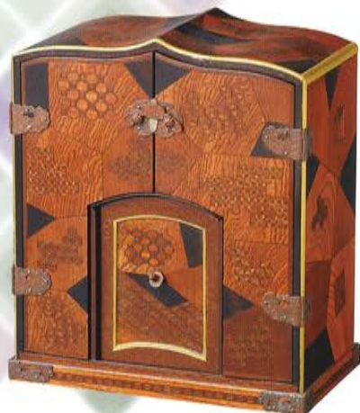
観音開扉寄木洋風厨子 (複製品)