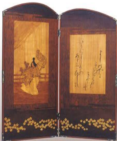
木象嵌二枚折屏風 「義経」と「静」