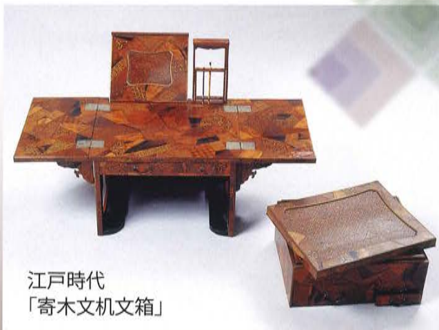
江戸時代 「寄木文机文箱」